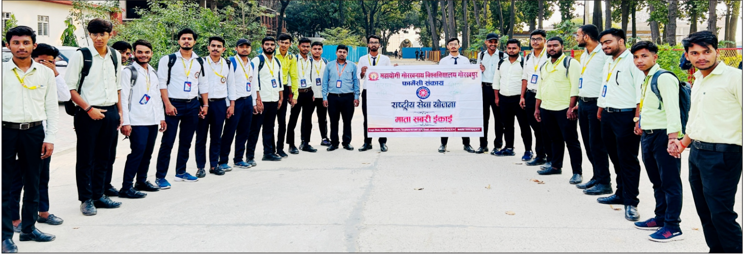
मिशन शक्ति फेज 5.0 के अंतर्गत मानव श्रृंखला बनाते हुए राष्ट्रीय सेवा योजना की पारिजात इकाई, माता शबरी इकाई एवं आर्यभट्ट इकाई के स्वयंसेवक

दिनांक : 15 अक्टूबर, 2024 को महायो गी गो र खाना था विश्वविद्यालय गोरखपुर में राष्ट्रीय सेवा योजना की पारिजात इकाई, माता शबरी इकाई एवं आर्यभट्ट इकाई के द्वारा मिशन शक्ति फेज 5.0 के अंतर्गत आज मानव श्रृंखला बनाकर समाज में महिलाओं के स्थान को मजबूत करने और उनकी भूमिका को पहचानने में एवं न केवल महिलाओं के लिए, बल्कि समग्र समाज के उत्थान में सहायक बनने के लिए