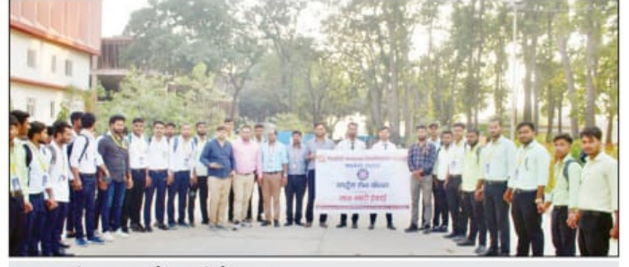
मानव श्रृंखला बनाते स्वयं सेवक ।